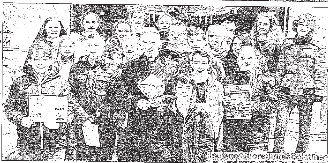
Istituto Suore Immacolatine

Venerdì 17 febbraio in Cattedrale una rappresentanza di diverse scuole paritarie presenti in Diocesi ha incontrato il Cardinale Angelo Bagnasco per la presentazione dei lavori svolti dai ragazzi per il concorso "Eucaristia è...", realizzato in occasione del Congresso Eucaristico nazionale celebrato a Genova lo scorso settembre. Le scuole: Santa Maria ad Nives di Pegli, Istituto Divina Provvidenza di S. Bartolomeo della Certosa, primaria Assarotti, istituto Suore Dorotee, istituto Suore Marcelline, scuole primarie e secondarie dell'Istituto delle Suore dell'Immacolata, istituto delle Suore dell'Immacolata di Quinto, scuole medie e superiori dell'istituto Emiliani si sono cimentati nella realizzazione di testi, poesie, disegni e video sul tema dell'Eucaristia. "La par-