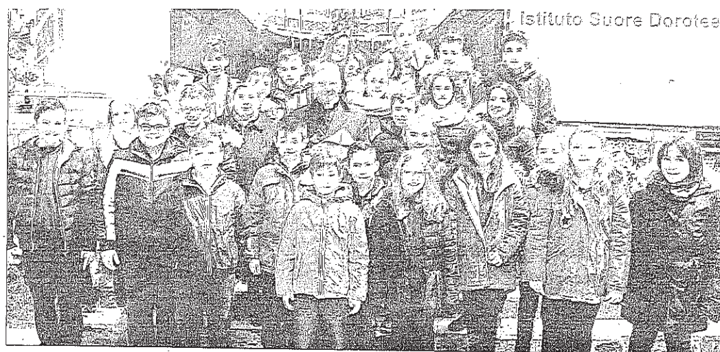
Istituto Suore Dorotee