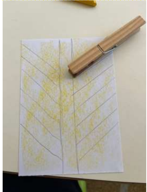
Sempre usando la molletta disegno delle linee oblique