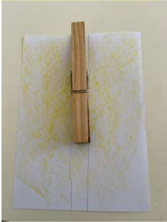
Con una molletta faccio una riga su un foglio che ho colorato di giallo