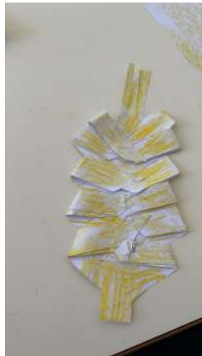
Ecco la mia palma!